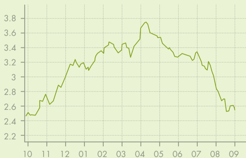
Jongste tienjarige staatslening vanaf 27-09-2010 t/m 26-09-2011

We leggen het u stap voor stap uit. Wat er aan de hand is, welk beleid we voeren en welke gevolgen de lagere rente en aandelenkoersen voor uw pensioen kunnen hebben. Voor de pensioenen die al zijn ingegaan, maar ook voor de opgebouwde pensioenen die nog niet zijn ingegaan. En zo mogelijk voor de toeslagverlening per 1 januari 2012, de indexatie. We beginnen met de lagere rente en lagere aandelenkoersen.